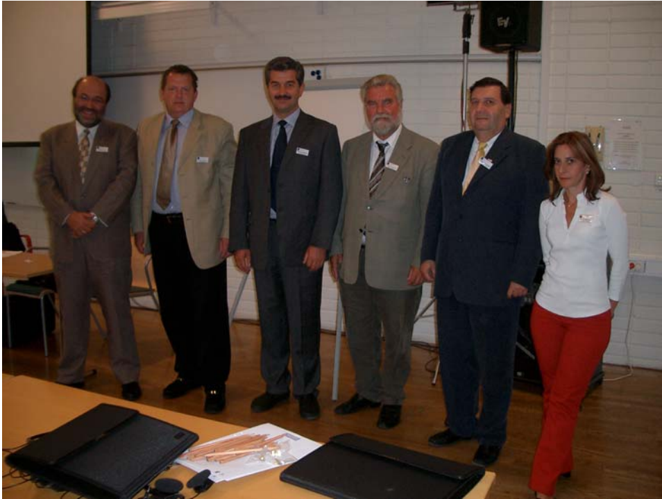
Die griechische Delegation mit ufe Präsident und ufe Generalsekretär