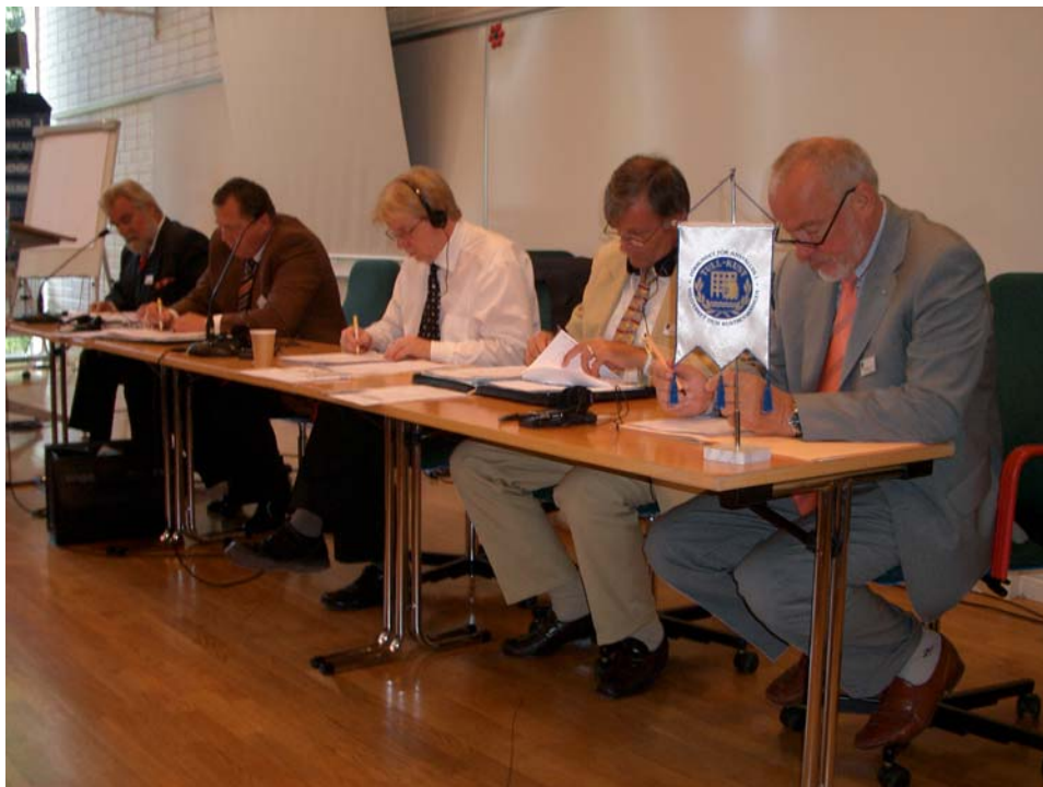
Das ufe Präsidium bei der ufe Komiteesitzung