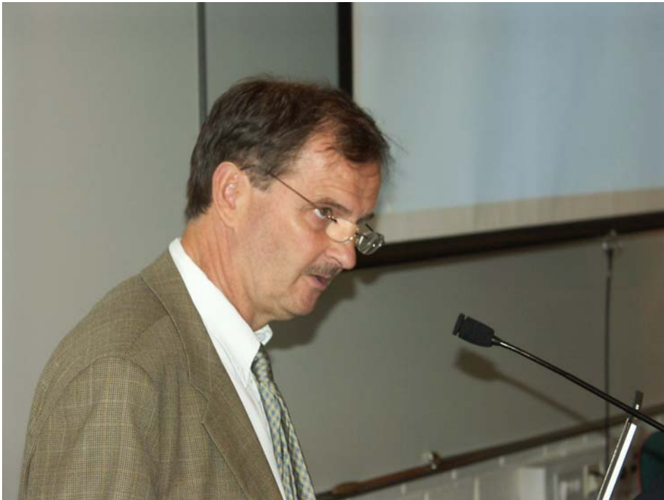
Der Generaldirektor des Zolls Göran Ekström bei seinen Ausführungen zu den Zukunftsaufgaben des Zolls.