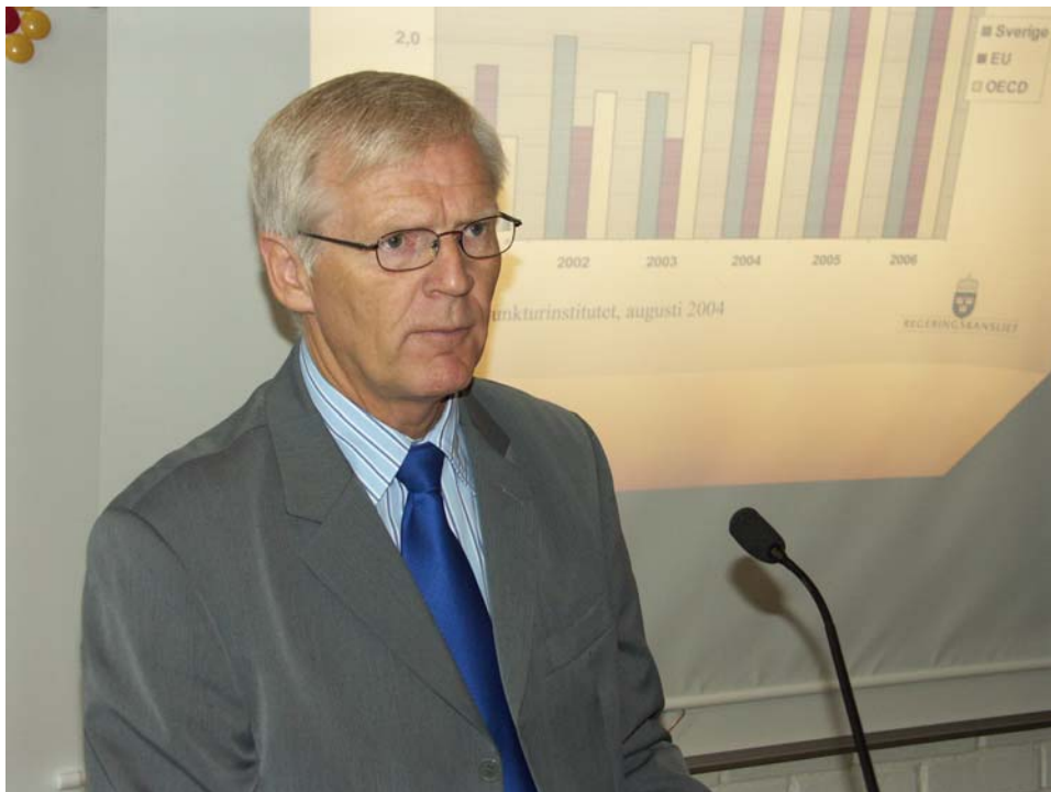
Der schwedische Finanzminister Bo Ringholm beim Festreferat.