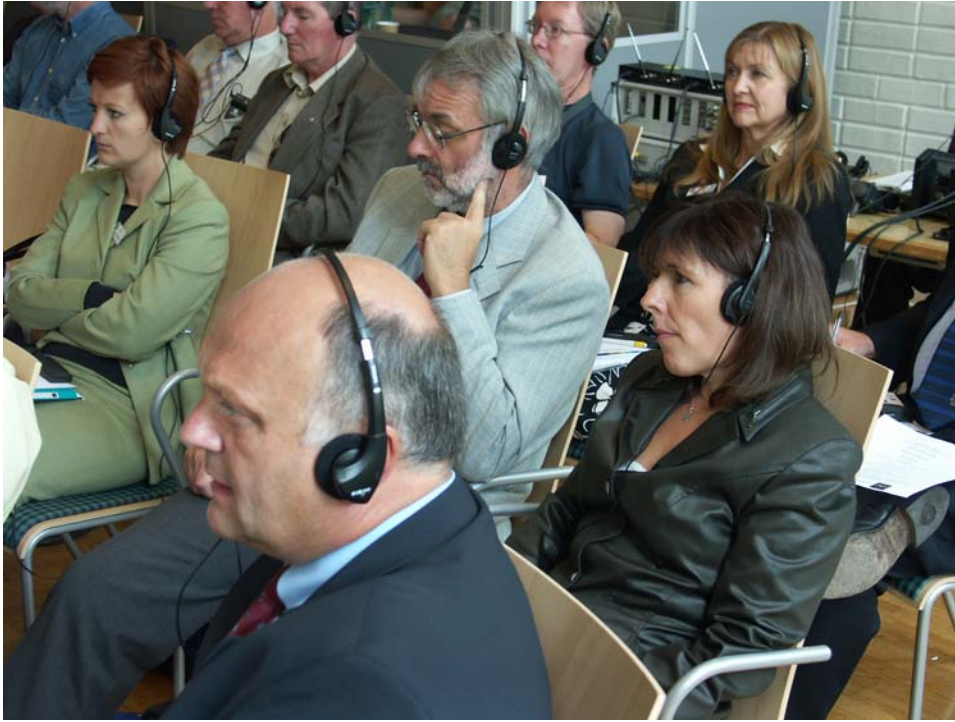
Angespannte Aufmerksamkeit beim ufe Komitee.